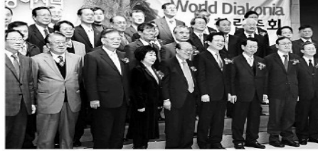
한국교회회망봉사단 정기총회 및 월드 디아코니아 출범식을 가진 뒤 임원들이 기념사진을 찍고 있다.