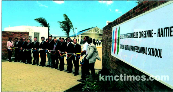
한국시간으로 11일 오전 1시(현지시간 10일 오전 11시) 아이티의 북부 도시 카라콜(Caracol)에서 열린 '아이티 직업학교(KHPS-Korean Haitian Professional School)' 제막식 모습.