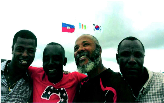
아이티 직업학교의 첫 신입생들이 학교 건물 준공을 반기며 활짝 웃고 있다. 학생들 뒤로 아이티 국기와 태극기, 아이티 직업학교의 깃발이 휘날린다.

"지진이 난 후 우리에게 희망이 없었습니다. 하지만 직업학교 덕분에 저는 다시 일어났어요. 더 많은 아이티 사람들이 그랬으면 합니다."