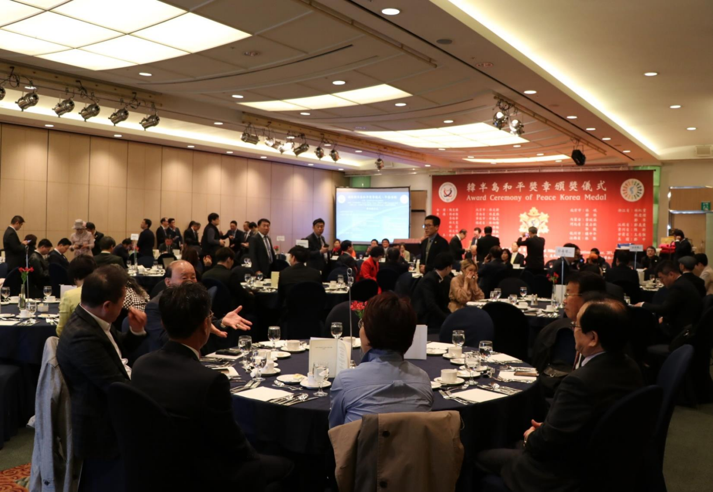
국내외 각계각층 많은 사람들이 <세계평화연대> 결성에 깊은 관심을 가지고 행사 모든 일정에 함께하며 격려와 축하를 보냈다.