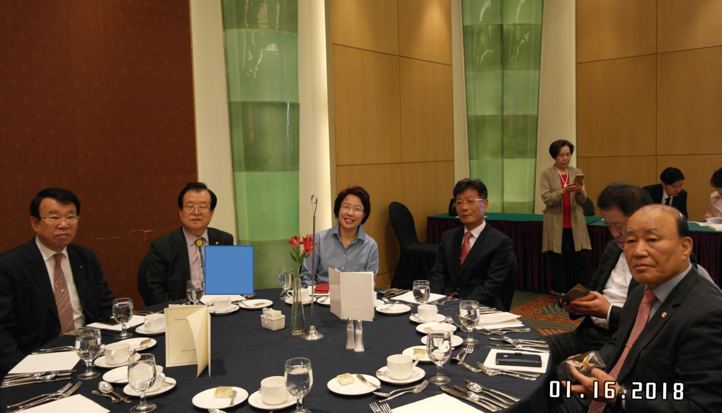
사단법인 우리민족교류협회 대한민국평화통일국민문화제 실행위원들께서 행사에 참여하여 적극 협력하였다.