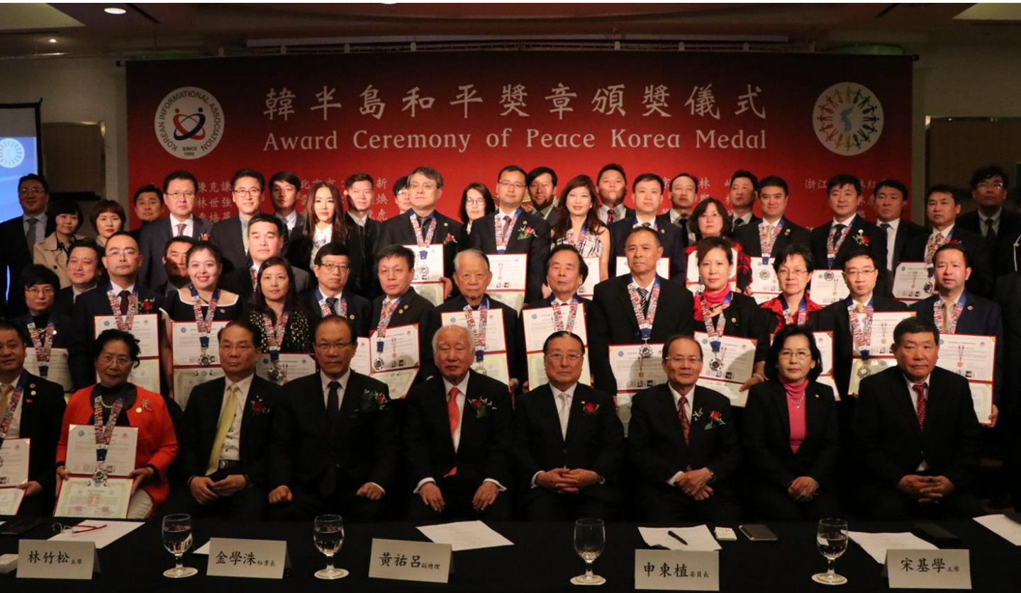
한반도 평화통일에 대한 국제적인 공감대 확산에 기여하고자 <세계평화연대> 결성에 공헌한 아시아지역 화교지도자들이 한반도 평화메달을 수여 받고 기념촬영을 했다.