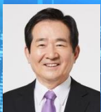
명예총재 정세균 2019~현재 (20대 국회의원)