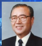
2대 총재 권영애 2011~2014 (30대 국방부장관)