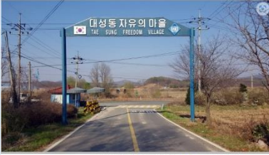
DMZ안에 위치한 단 하나 의 마을, 대성동마을

남한에서 유일하게 비무장지대(DMZ) 내에 위치한 대성동 마을은 공동경비구역(JSA) 내에 위치한 특수한 마을이다. 1953년 7월 정전협정을 체결할 당시, '남북 비무장지대에 각각 1곳씩 마을은 둔다'는 규정에 따라 그해 8월 3일 북한 기정동마을과 함께 조성됐다.