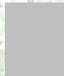
특별기도 OOO 목사 영국오픈도어선교회 oooo