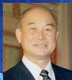
1대 총재 강영훈 1990~2010 (21대 국무총리)

A meeting square for Koreans at home and abroad to create Peace and Reunification beyond the wounds and pains of national division.