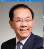
5대 총재 왕우여 2022~현재 (전. 사회부총리)