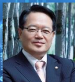
명예총재 정의화 2015~현재 (19대 국회의원)