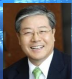
3대 총재 김성오 2015~2018 (68대 법무부장관)