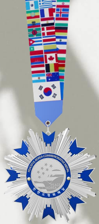
한반도평화메달 PEACE KOREA MEDAL

The Peace Korea Medal awarded to the winners today was made by melting the DMZ rusty barbed wire, which is a symbol of the Korean War and the field of the division of the Korean Peninsula, and by melting the casings used during the war in which the soul of the Korean War Veterans were enthralled. The necklace on the medal imaged the national flags of the countries that participated in the war between the two Koreas during the Korean War and the countries that supported the post-war restoration project of the Republic of Korea.