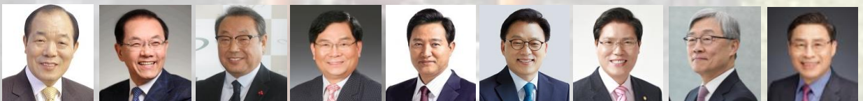
개회사 김영진 조직위원장 전, 농림부장관 대표인사 황우여 우리민족교류협회 총재 전, 부총리 겸 교육부장관 환영사 권오주 우리민족교류협회 대표회장 경과보고 송기학 사, 우리민족교류협회 이사장 축사 오세훈 서울특별시 시장 축사 박광은 전, 국회의원위원장 더불어민주당 축사 송석준 대한민국 국회의원 국민의힘 축사 최재영 대한민국 국회의원 국민의힘 2부 사회 장헌일 한국공공정책개발 연구원 원장