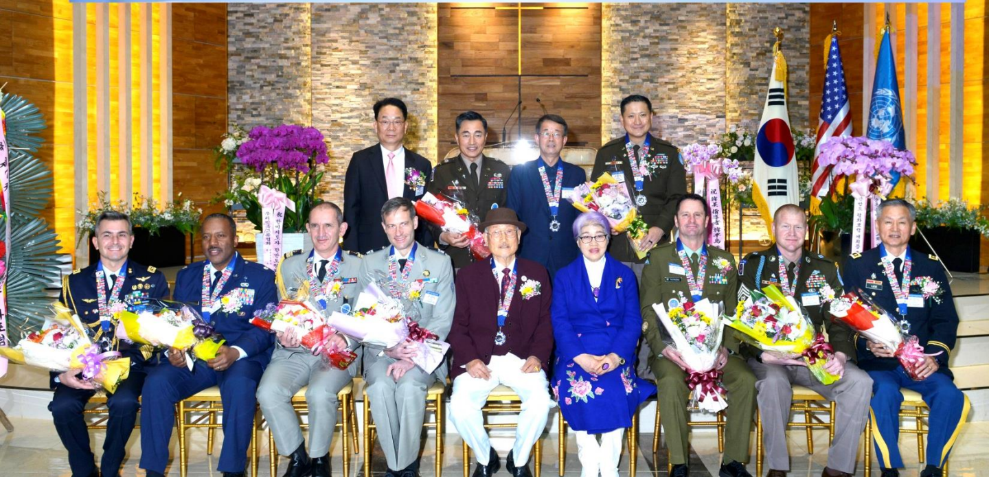
한반도평화메달 수상자들이 기념촬영을 하고 있다

특히 이 자리에는 유엔사에 근무 중인 Coras 프랑스군 대령을 비롯하여 Etori 대령, 그리고 Gigante 이태리군 대령, Buckley 뉴질랜드군 준위 등 다국적 지휘관들이 수상자로 참석해 눈길을 끌었고, 총 수상자 15명중 대령이 6명으로 향후 본 행사의 발전 가능성을 가늠케 했다.