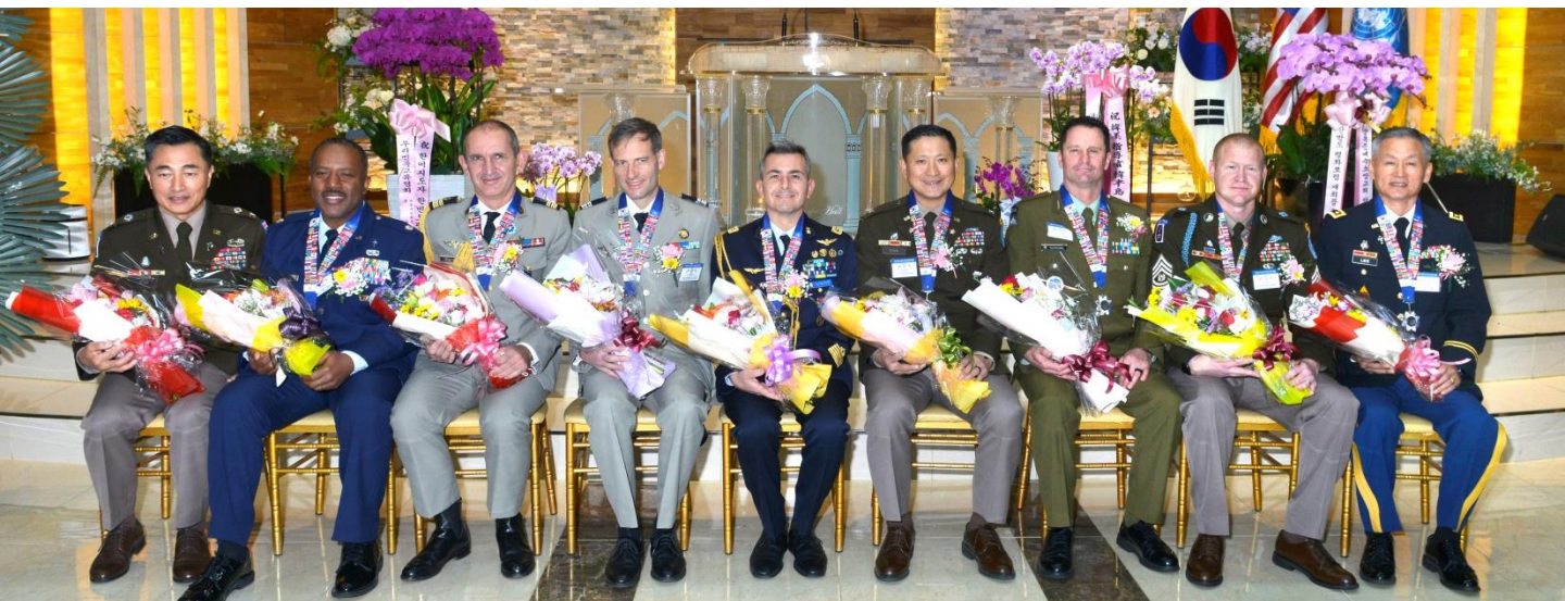
유엔사, 연합사, 미군사 소속 수상자들이 기념촬영을 하고 있다