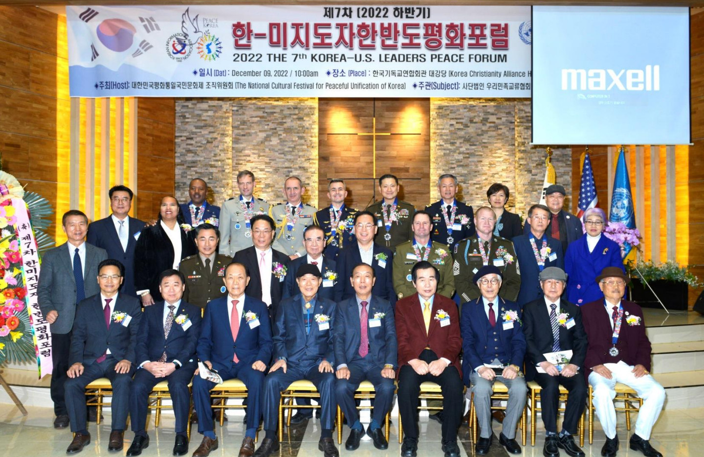
행사 주요 순서자들과 한반도평화메달 수상자들이 기념촬영을 하고 있다

주한유엔사(UNC), 한미연합사(CFC), 주한미군사(USFK) 장병들께 DMZ 녹슨 철조망과 탄피를 녹여 제작한 한반도평화메달 수여