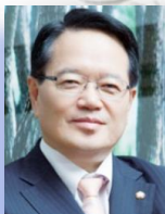
명예위원장 정 의 화 제19대 국회의장

회 장 권 오 주 북방선교실무총재 김 진 우 북방선교실무회장 정 귀 석 이 사 장 송 기 학