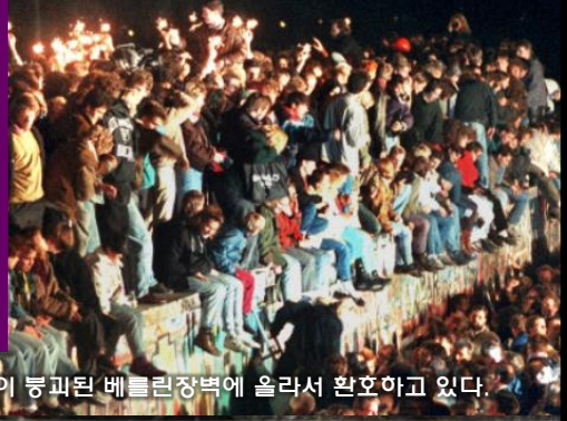
시민들이 붕괴된 베를린장벽에 올라서 환호하고 있다.