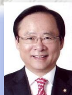
조직위원장 이 주 영 전 국회의부의장