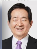
명예총재 정 세 균 제20대 국회의장