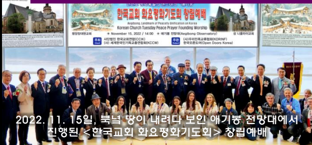
2022. 11. 15일, 북녘 땅이 내려다 보인 애기봉 전망대에서 진행된 <한국교회 화요 평화기도회> 창립예배