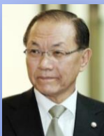
총 재 황 우 여 전, 사회부총리