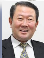
조직위원장 박 주 선 전 국회의부의장