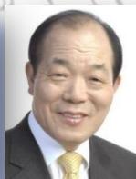
조직위원장 김 영 진 전 농림부장관