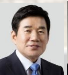
격려사 김 진 표 국회의장