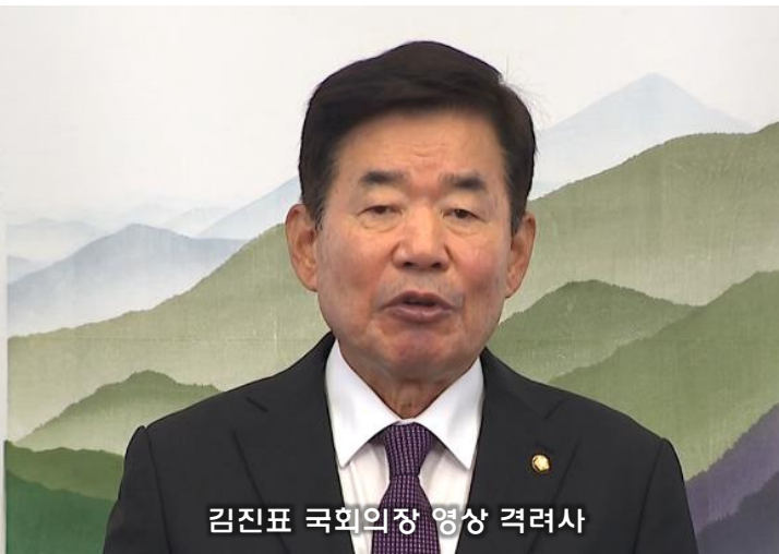
김진표 국회의원 영상 격려사