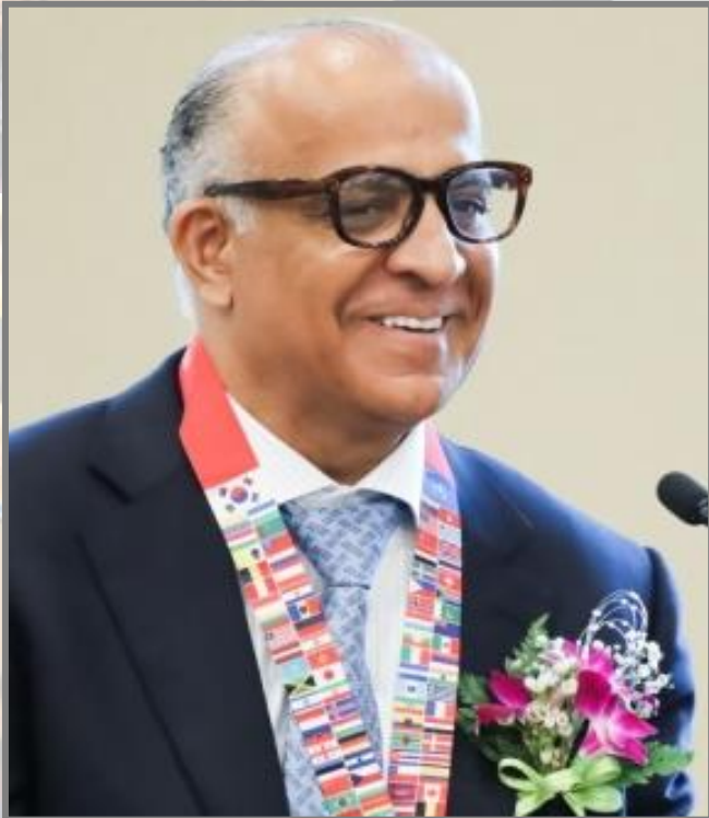
명예정치학박사 문르 카즈미르 (미국유대인협회 수석부회장)