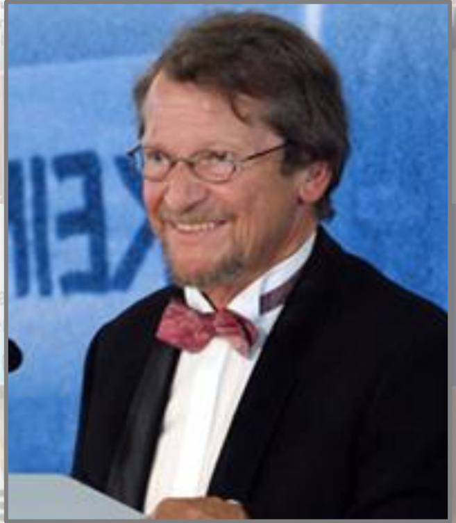
명예신학박사 크리스토프 본네베르거 (동독 월요평화기도회 지도자)