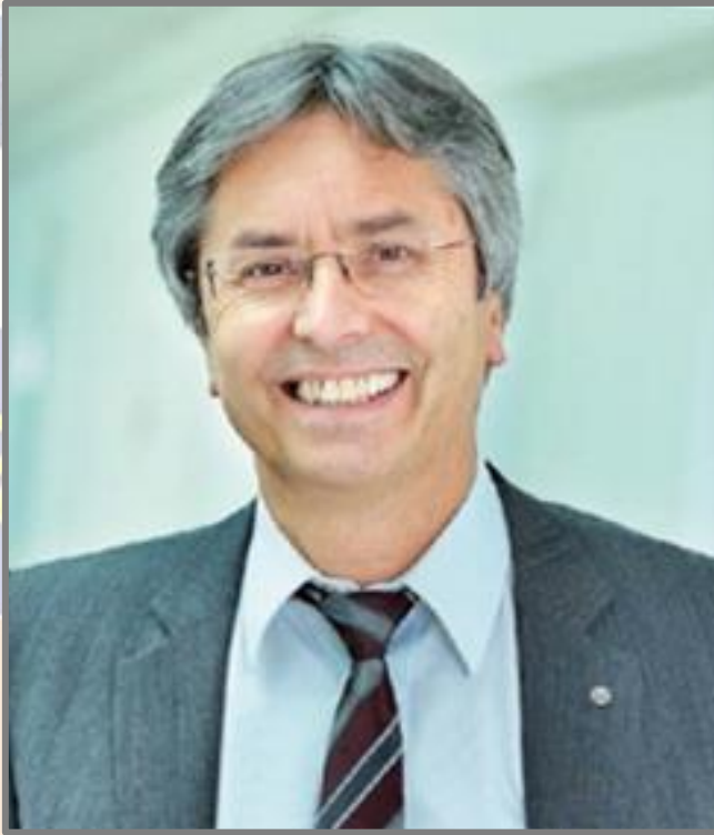
명예교육학박사 한스 뮐러-슈타인하겐 (독일 드레스덴대학교 총장)