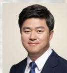
축 사 박 상 혁 김포(울)국회의원