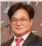
환영사 김 병 수 경기도 김포시 시장