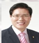
축 사 송 석 준 국회의원 전, 해병2사단장훈관