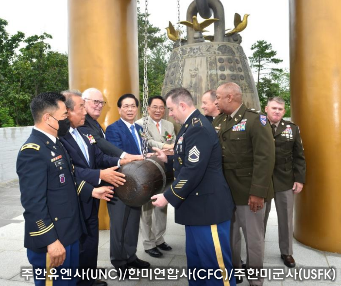
주한유엔사(UNC)/한미연합사(CFC)/주한미군사(USFK) 장병들과 행사 참가자들이 남북평화의 종을 타종하고 있다