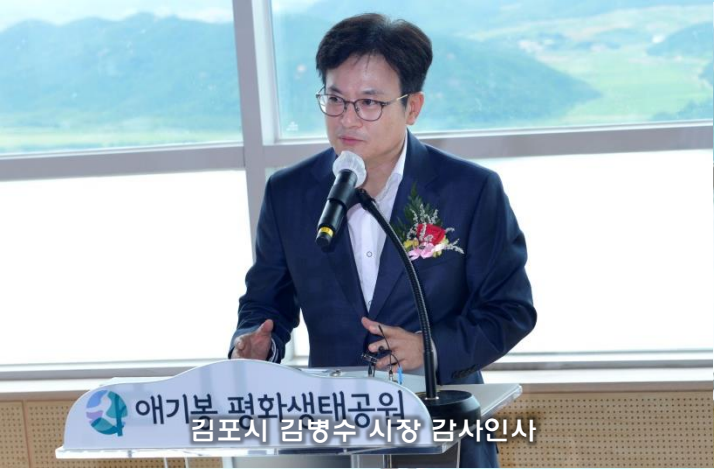
애기봉 평화생태공원 김포시 김병수 시장 감사인사