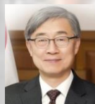
축 사 최 재 형 국회의원 국민의힘 혁신위원장