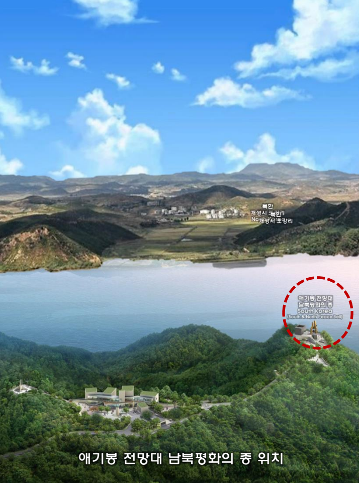
에기봉 전망대 남북평화의 종 위치