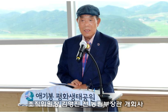
애기봉 평화생태공원 조직위원장 김영진 전 농림부장관 개회사