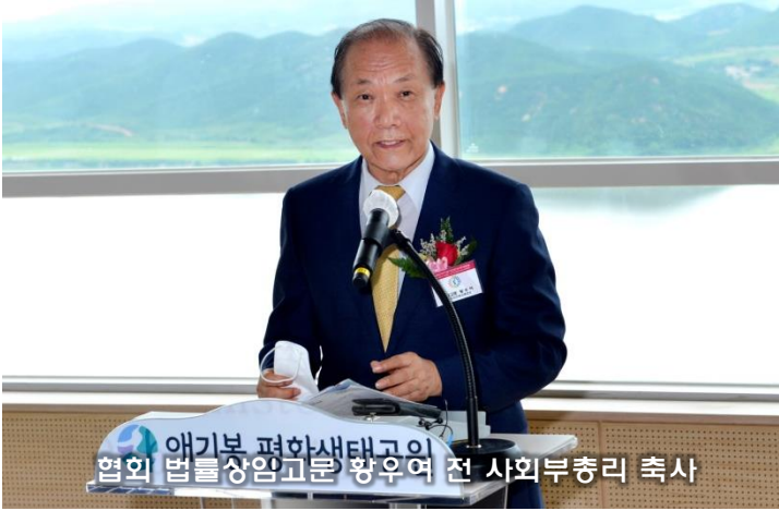
애기봉 평화생태공원 협회 법률상임고문 황우여 전 사회부총리 축사