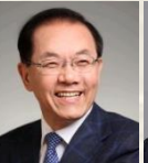
축 사 황 우 여 전, 교육부장관 겸 사회부총리