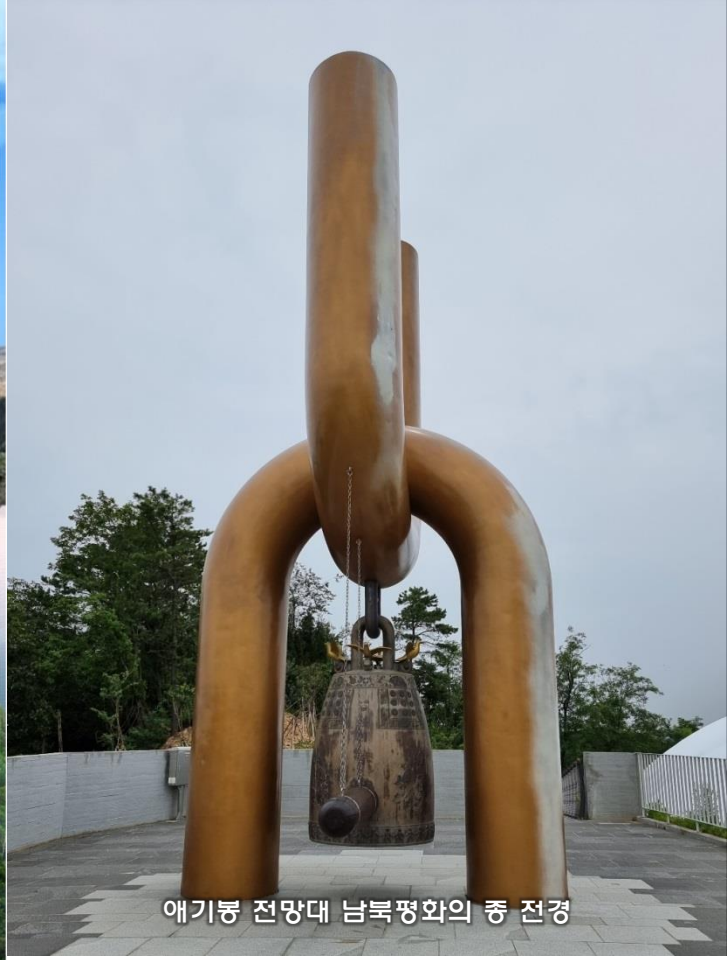
에기봉 전망대 남북평화의 종 전경