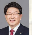
축 사 권 성 동 국회의원 국민의힘 원내대표