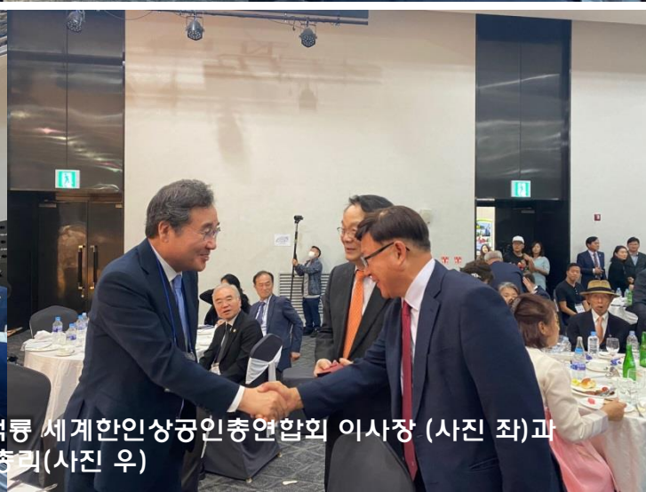
본 협회 초창기부터 많은 협력을 해주셨던 김덕룡 세계한인상공인총연합회 이사장 (사진 좌)과 이낙연 전 총리(사진 우)