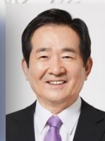
명예총재 정 세 균 제20대 국회의장