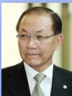
총 재 황 우 여 전, 사회부총리