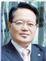
명예위원장 정 의 화 제19대 국회의장

명예총재 정세균 | 이영훈 회장 권 오 주 총 재 황 우 여 북방선교실무총재 김 진 우 여성총재 이 재 희 북방선교실무회장 정 귀 석 부총재 김 태 식 이 사 장 송 기 학