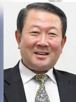
조직위원장 박 주 선 전 국회의부의장