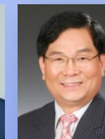
이 사 장 송 기 학 통일로가논길 발명인