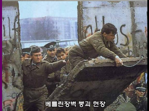
베를린장벽 붕괴 현장