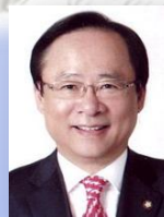
조직위원장 이 주 영 전 국회의부의장