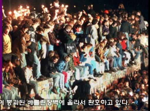
시민들이 붕괴된 베를린장벽에 올라서 환호하고 있다.