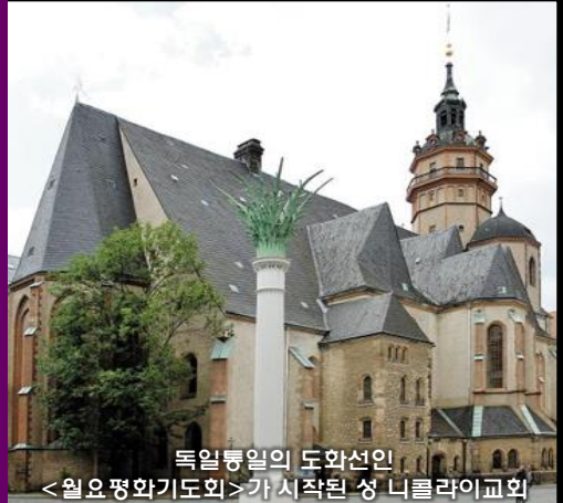
독일통일의 도화선인 <월요 평화기도회>가 시작된 성 니콜라이교회

지난 2007년에 평양에서 일어났던 대 부흥운동이 다시 한번 일어나 북녘 땅의 무너진 교회들이 재건되기를 기대하는 당신의 간절한 기도와 관심이 민족의 평화통일을 앞당기는 불씨가 될 수 있기 때문입니다.