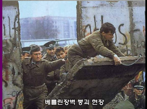
베를린장벽 붕괴 현장