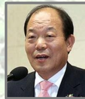
격려사 김영진 장로 전, 농림부장관