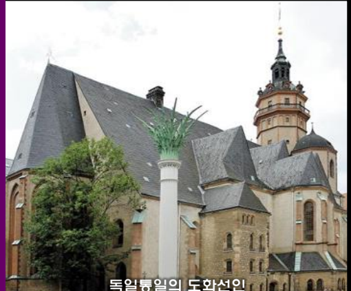
독일통일의 도화선인 <월요 평화기도회>가 시작된 성 니콜라이교회

지난 2007년에 평양에서 일어났던 대 부흥운동이 다시 한번 일어나 북녘 땅의 무너진 교회들이 재건되기를 기대하는 당신의 간절한 기도와 관심이 민족의 평화통일을 앞당기는 불씨가 될 수 있기 때문입니다.