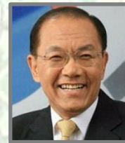
격려사 황우여 장로 전, 교육부장관 겸 사회부총리