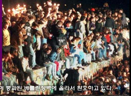
시민들이 붕괴된 베를린장벽에 올라서 환호하고 있다.