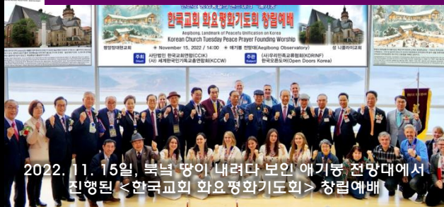
2022. 11. 15일, 북녘 땅이 내려다 보인 애기봉 전망대에서 진행된 <한국교회 화요 평화기도회> 창립예배