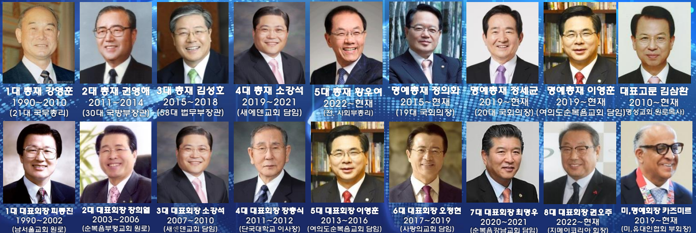
1대 총재 강영훈 1990~2010 (21대 국무총리)

A meeting square for Koreans at home and abroad to create Peace and Reunification beyond the wounds and pains of national division.