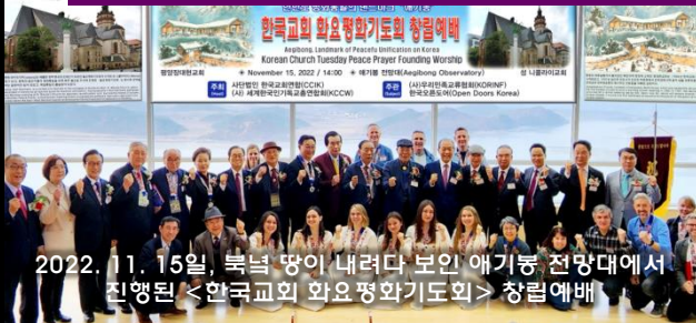
2022. 11. 15일, 북녘 땅이 내려다 보인 애기봉 전망대에서 진행된 <한국교회 화요 평화기도회> 창립예배