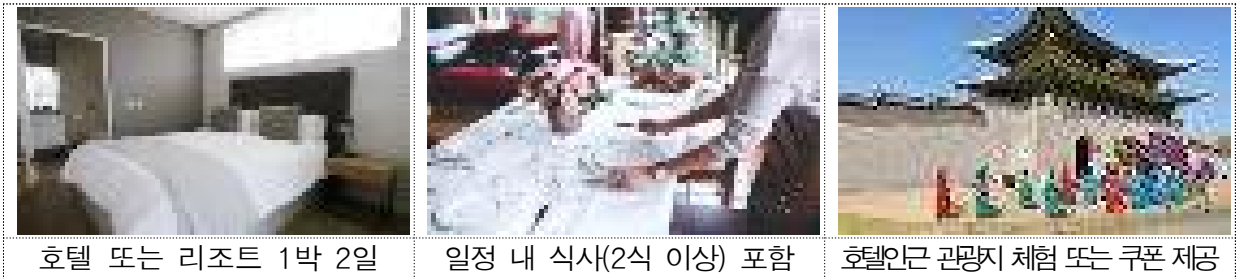
호텔 또는 리조트 1박 2일